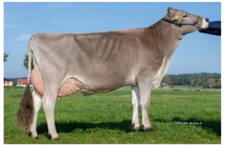
HEBRON la figlia SCHEDEL in 1 lattazione Dati aggiornati al 04/04/2023