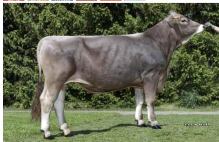
CEZANNE Dati aggiornati al 04/04/2023