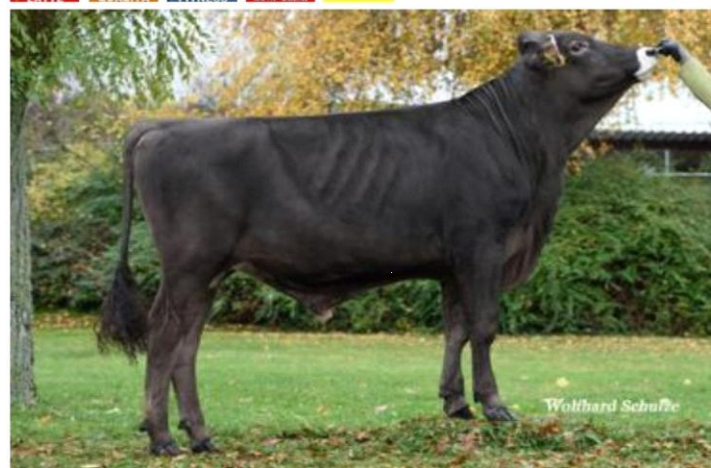
CALDERON Dati aggiornati al 04/04/2023