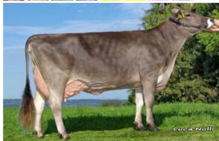
SEVILLA la madre AZ 1472 in seconda lattazione Dati aggiornati al 04/04/2023