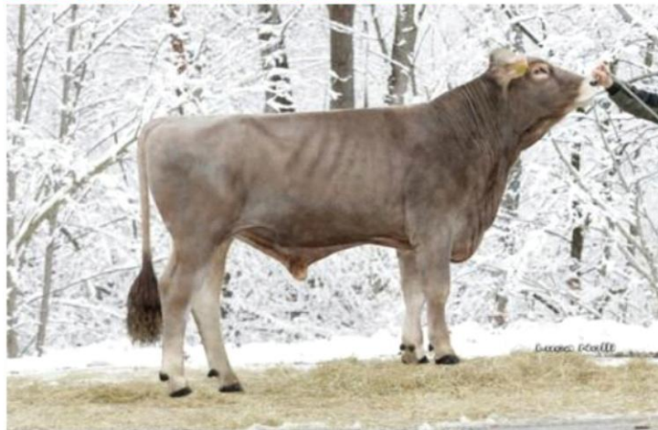
VALOR Dati aggiornati al 04/04/2023