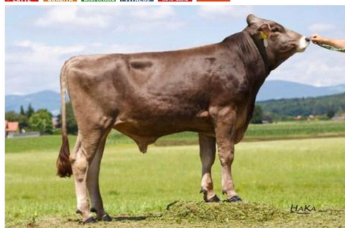
VORSPRUNG Dati aggiornati al 04/04/2023