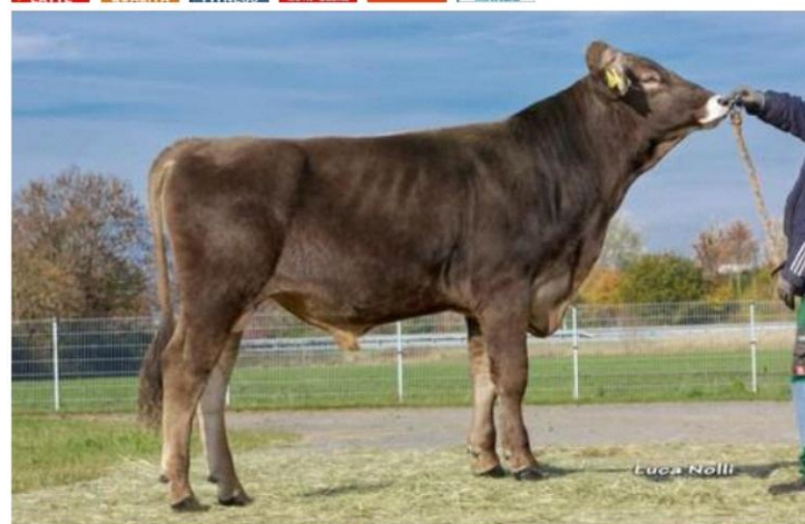
JULI Dati aggiornati al 04/04/2023