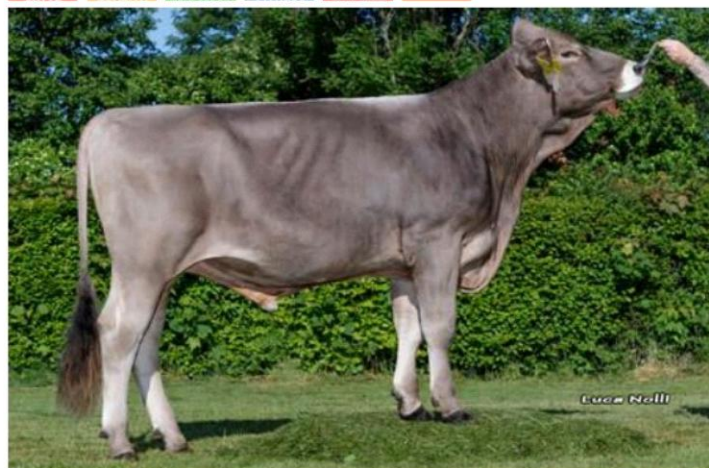
VALLEJO Pp Dati aggiornati al 04/04/2023