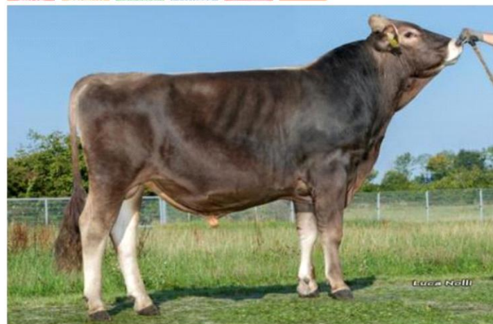
VOLLMILCH Dati aggiornati al 04/04/2023