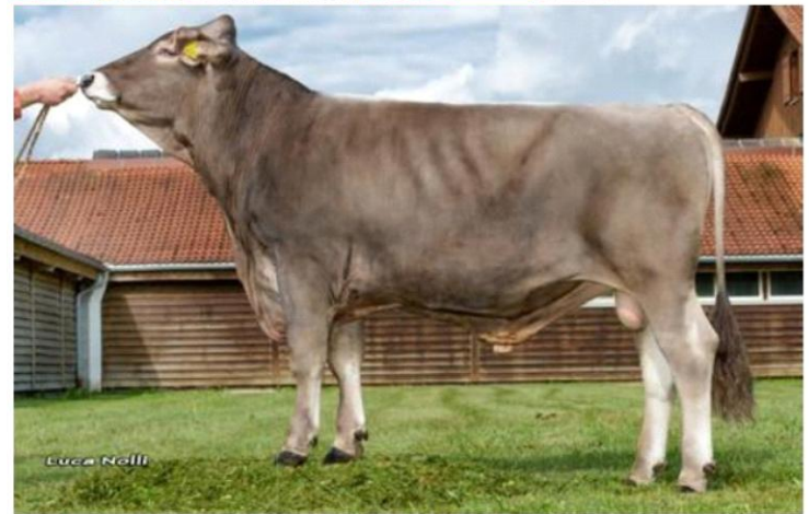
VASARY Dati aggiornati al 04/04/2023