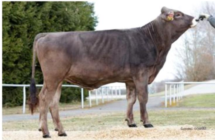
CASANOVA Dati aggiornati al 04/04/2023