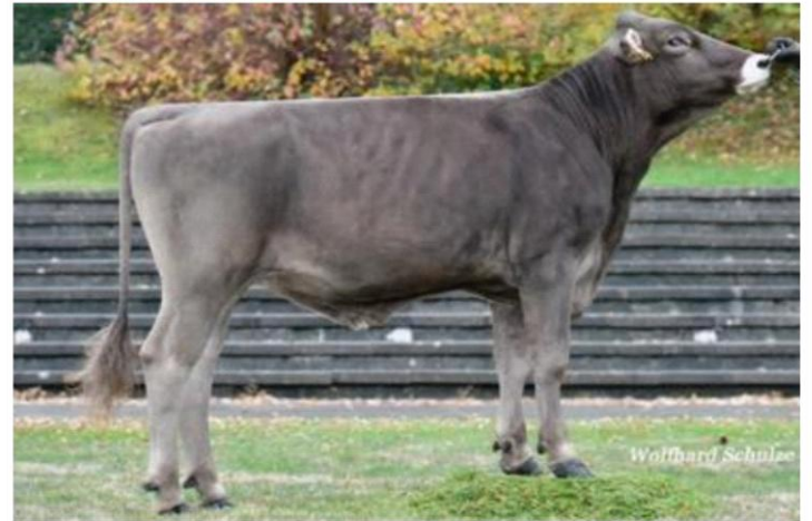
VALID Dati aggiornati al 04/04/2023