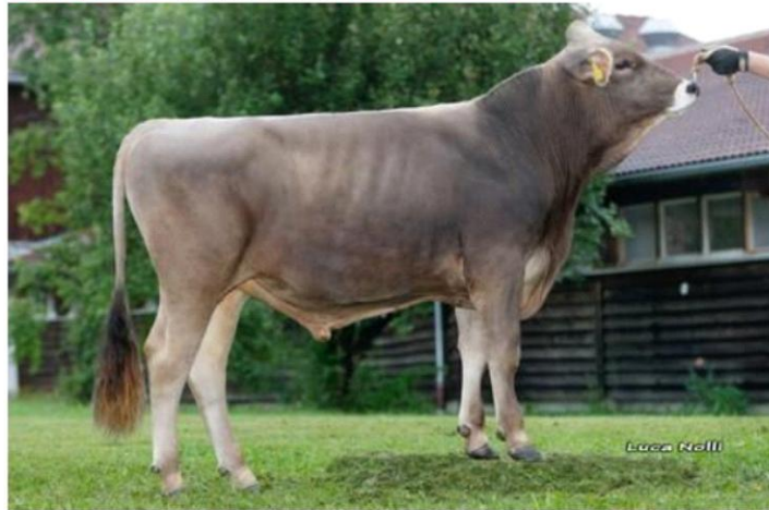
PIANO Dati aggiornati al 04/04/2023