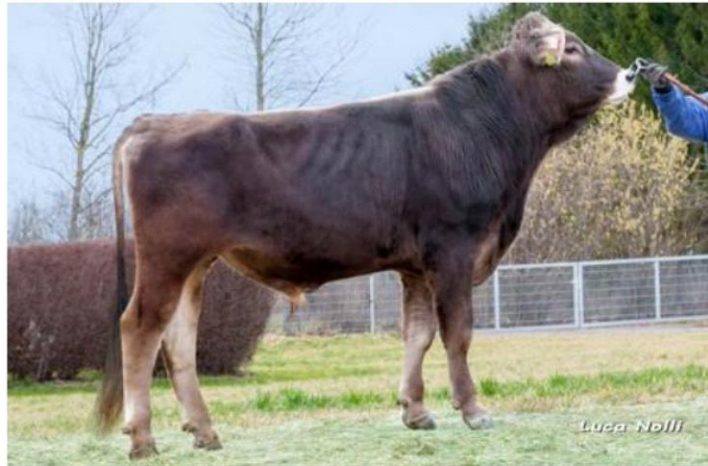
HERCULES Dati aggiornati al 04/04/2023