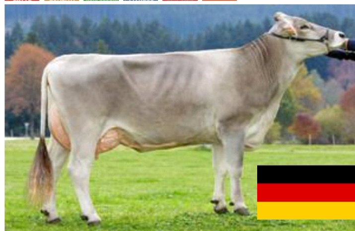
HUSTLER LA MADRE PIERA IN 2 LAT