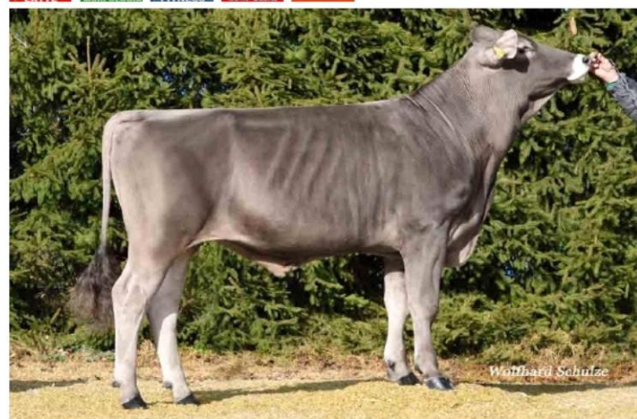
CARAVAGGIO Dati aggiornati al 04/04/2023