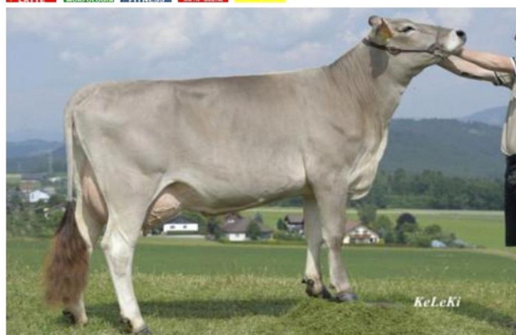
PAYSSLI la figlia OSRA Dati aggiornati al 04/04/2023