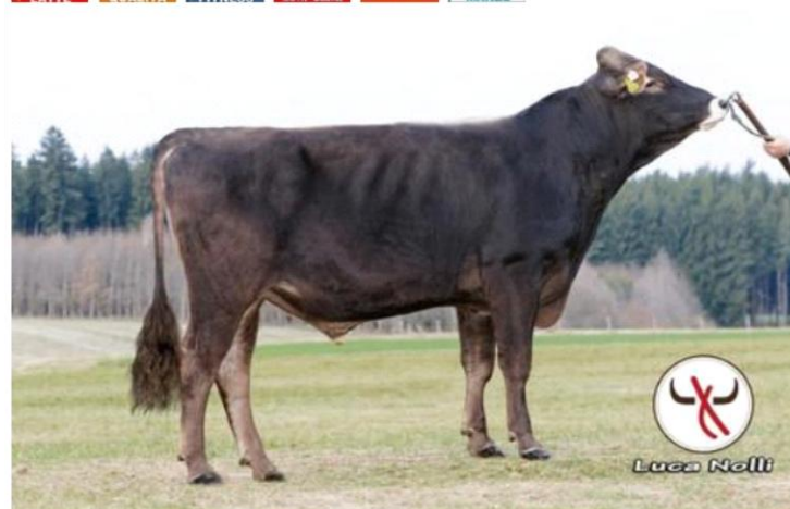
VAJO Dati aggiornati al 04/04/2023