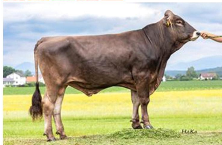
INDICE PRODUZIONE FIGLIE IN PRODUZIONE: 0 ATT: 54%