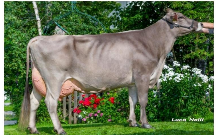
JUCATOR Dati aggiornati al 04/04/2023