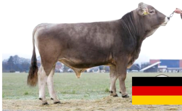
CAVALLO il padre di CALIBUR