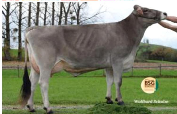
CHAGALL Dati aggiornati al 04/04/2023