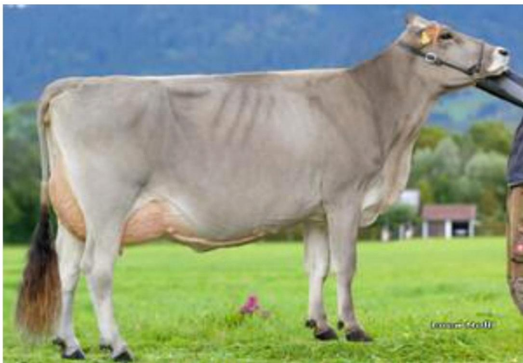
JUCATOR la figlia URSULA in 1 lattazione