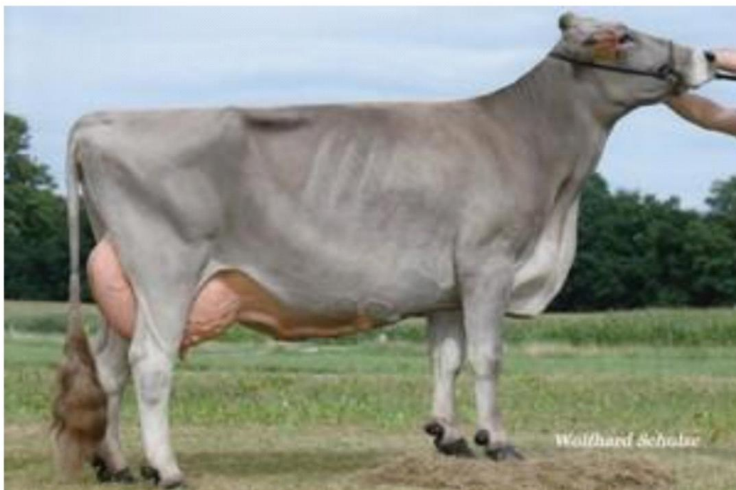
PIAGGIO la madre INKA