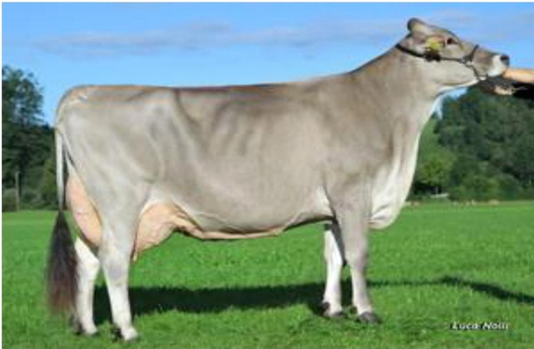
HERCULES la nonna HELEN