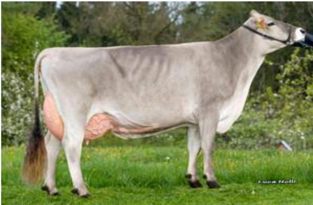
VELES Pp la madre SCHLECKER