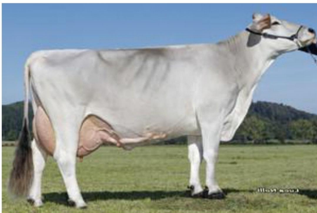
PASADENA la nonna RHOTUVA