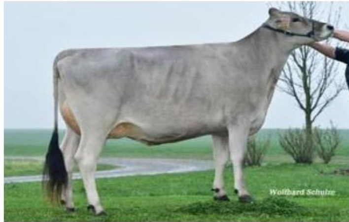
ASSAY la madre QUALI