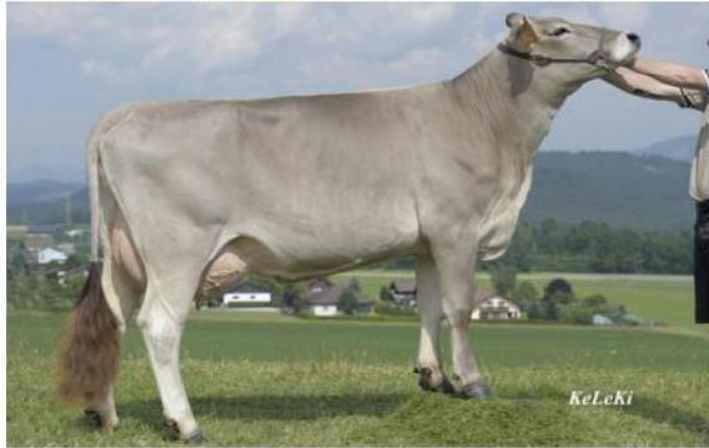
PAYSSLI la figlia OSRA